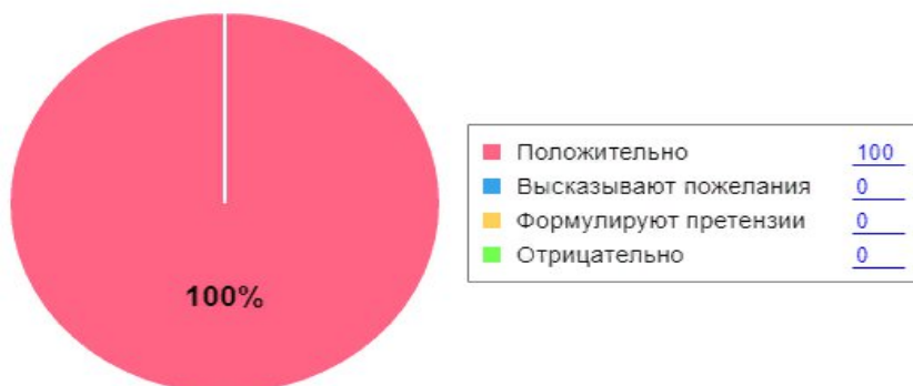
Как родители оценивают детский сад

Выводы: требуется продолжать деятельность ДОУ по расширению форм активного взаимодействия с родителями, направленную на повышение компетентности родителей в вопросах развития и образования, а также обеспечивающую открытость образовательной организации.