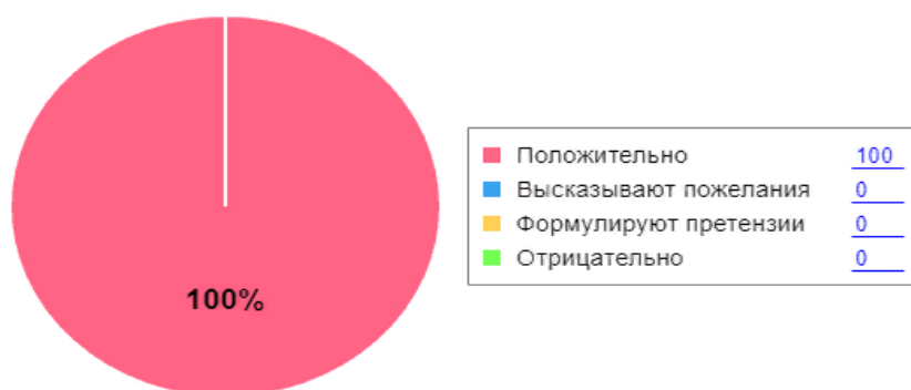
Как родители оценивают детский сад

Выводы: требуется продолжать деятельность ДОУ по расширению форм активного взаимодействия с родителями, направленную на повышение компетентности родителей в вопросах развития и образования, а также обеспечивающую открытость образовательной организации.